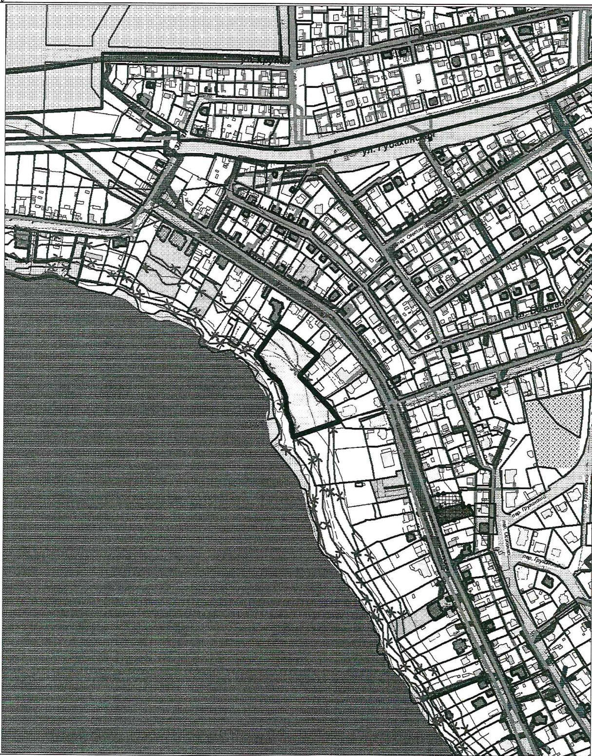
Схема расположения земельного участка в окружении смежно расположенных земельных участков